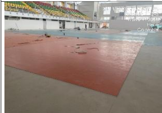
Canchas con sus accesorios