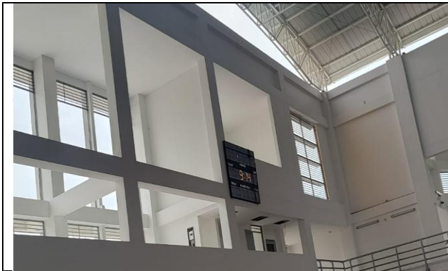
Estuco y pintura

modelo integrado de planeación y gestión