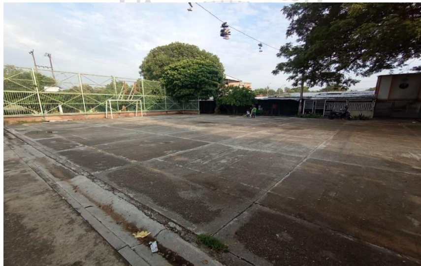
Estado actual Polideportivo Minuto de Dios III Etapa