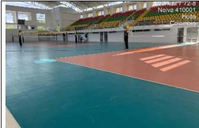
Instalación de canchas