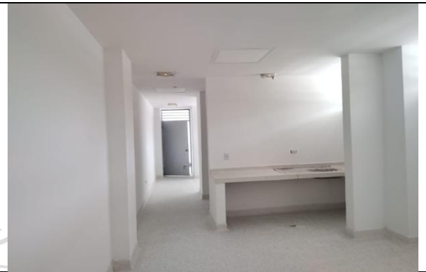
Estuco y pintura