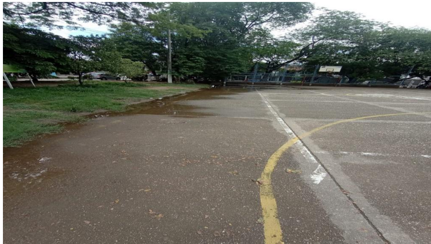
Estado actual Álamos Norte