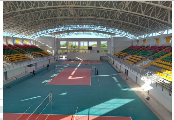
Instalación de las canchas